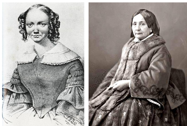
Retrato de Suzanne Voilquin y fotografía de Eugénie Niboyet

En los años posterior a la desaparición del grupo, además de los textos autobiográficos de Suzanne Voilquin, destaca el libro que Eugénie Niboyet publicó en 1863 Le vrai livre des femmes 14 . El último capítulo es una breve biografía en la que Niboyet pretende darse a conocer mejor a sus lectores. Presenta su vida como ejemplar, llena de abnegación y buenas intenciones (Riot-Sarcey 1987- 62). Haciendo un ejercicio de “memoria selectiva”, quiere destacar su trabajo como escritora y restar importancia a su pasado sansimoniano. Enumera los medios en los que participó y al referirse al periódico La Voix des Femmes comenta que fue la época más dolorosa de su vida (Niboyet 1863: 231). También resulta llamativo que no nombra a ninguna de sus compañeras de lucha. Y, cuando las menciona indirectamente, es para criticar su comportamiento en los proyectos que llevaron a cabo juntas o para censurar la decisión de exiliarse que algunas de ellas tomaron tras el golpe de Estado de Napoleón III. Para varias de sus compañeras también serían censurables los nuevos posicionamientos de Niboyet, que alababa al nuevo Emperador.