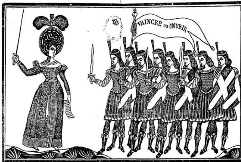
Nuevo ejército de mujeres sansimonianas. Litografía. 1832.

Proclamation adressée par le Général de ce nouveau Régiment à ses compatriotes. — Marche guerrière sur ce sujet.